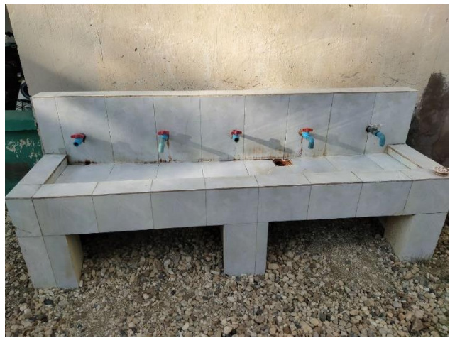
2. アンポー小学校 Ampov Prey primary school アンポー小学校も清掃が行き届き、清潔に使用されている。