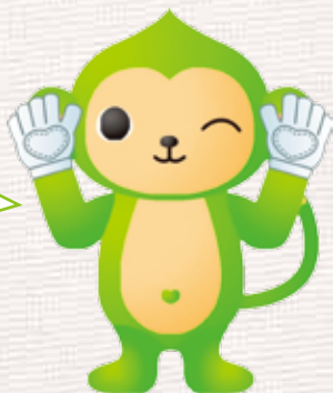
香川県ゲートキーパー推進キャラクター 「きーもん」

動画制作：香川大学メンタルヘルス研究プロジェクト (メンプロ) 香川大学医学部公衆衛生学