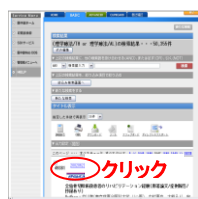
検索結果一覧画面